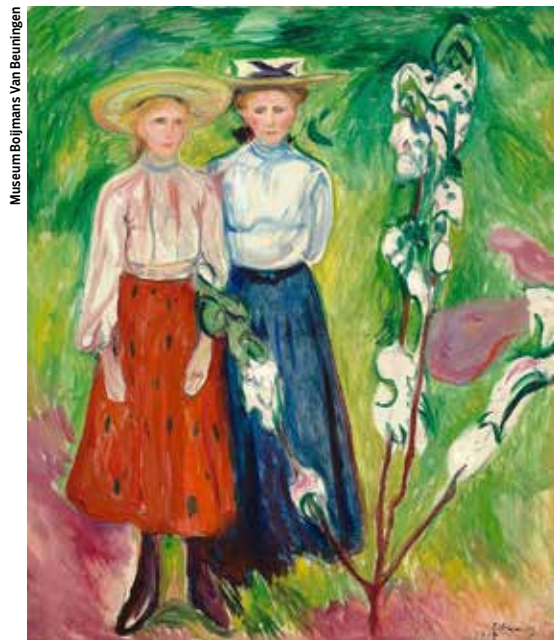
Museum Boijmans Van Beuningen

niet aan alle details ook zo waar te nemen. De groene tuin daarentegen is anders geverfd: een los beweeglijke vrijheid met lange, buigzame halen van groen en geel. Hier in dat luisterrijke groen ontstaat het stralende licht. Dat geel en groene en ook roze licht zijn achtergrond en ruimte in het doek. Nog vóór waar de vrouwen staan, komen van onderuit de dunne, opwaartse takken van een jonge appelboom naar boven, vol met zware, witte bloesems. Die ranke takken tekenen ook ruimte in het schilderij. Daarachter staan zwijgend de vrouwen te kijken. Eigenlijk is al dat groen, die ruimtelijke verwarring van groen, een schilderij op zich. Het is daar geen realistisch geschilder meer. Het kan zijn dat het geveegde roze, onderin, de kleur was van een stuk tuinpad. Maar dat vraag ik me niet meer af. Dat roze is gewoon de kleur van de verf die Munch daar wilde schilderen omdat die kleur roze goed paste bij het geel en verschillende tinten groen elders in de tuin. Toen Munch het schilderij in 1905 schilderde, begon de kunst te veranderen. Twee, drie jaar later begon het kubisme. Alles werd anders.